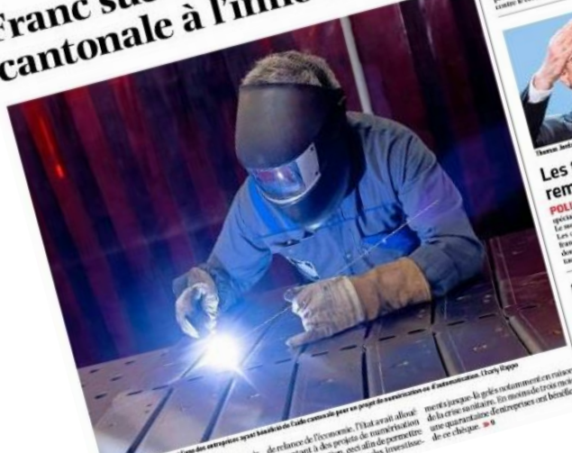
Carole SA, à Dornach, est l'une des entreprises ayant bénéficié de l'aide cantonale pour un projet de recherche et d'innovation. Thibault J. Mottet